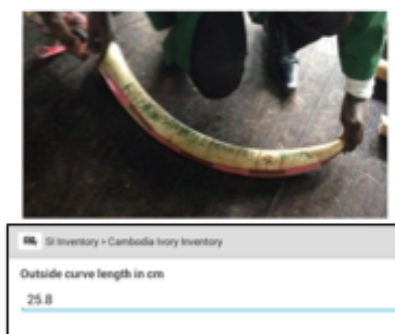
Medindo e introduzindo os dados sobre o tamanho da presa