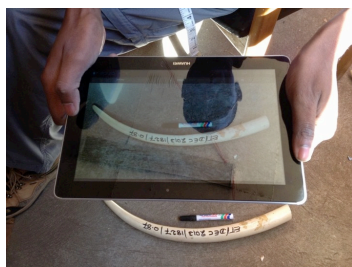
Tirando uma fotografia com a App

O objetivo é que os gerentes de armazenamento possam gravar dados digitais sobre o marfim quando este chega ao armazém. Quando novos dados são inseridos na aplicação, os dados são carregados no servidor usando Wi-Fi ou dados móveis. Isto resulta em dados de stock em tempo real no servidor.